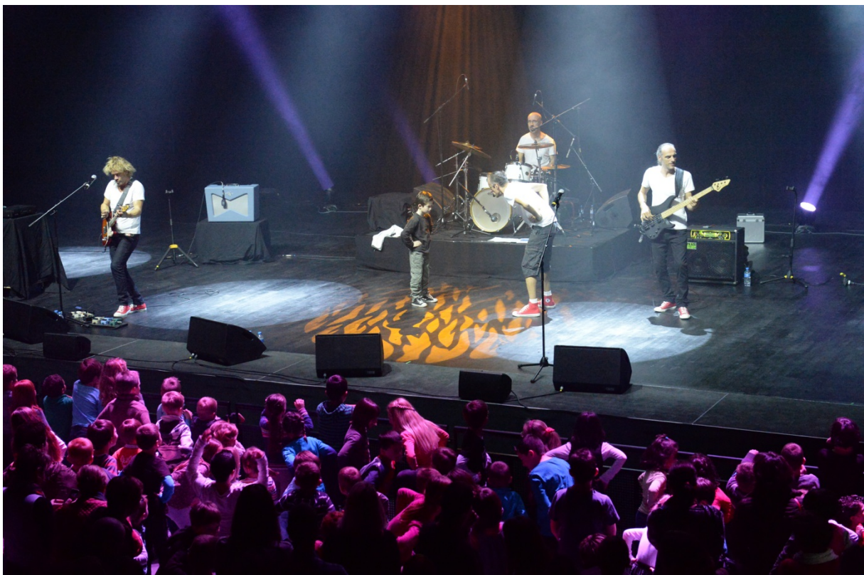
→ Extrait de l'édition précédente : Concert pour les plus jeunes.

Depuis 2005, le Festival s'est imposé comme un rendez-vous incontournable autour des musiques actuelles en Haute-Marne. « Le festival a accueilli aujourd'hui plus de 65 groupes et trouvé un réel écho auprès du public » conclut Ilona Pietrzok.