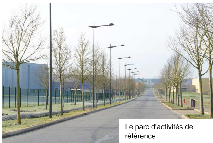
Le parc d'activités de référence

Chiffres clés : 71 ha disponibles / 25 entreprises installées / 12 € le m 2 .