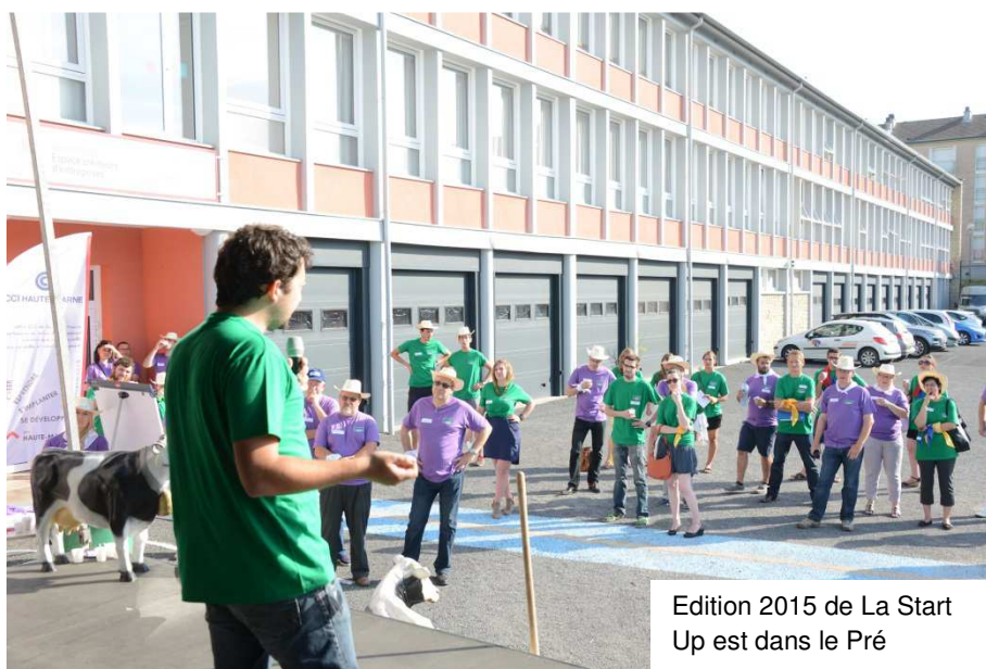
Edition 2015 de La Start Up est dans le Pré

Chiffres clés : 29 bureaux / 9 ateliers / 2500m 2 / 20 entreprises hébergées / 50 emplois créés depuis 2013