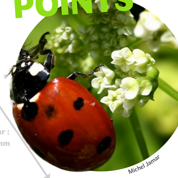
Longueur : 5,5 à 8 mm

le cou de l'homme qui devait être décapité. Le roi interpréta cela comme une intervention divine et libéra le condamné. Quelques jours après cette intervention, le véritable meurtrier fut arrêté. Depuis cette histoire, la coccinelle est considérée comme un porte-bonheur !